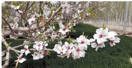
■莎车县托库孜买提村巴旦木花。