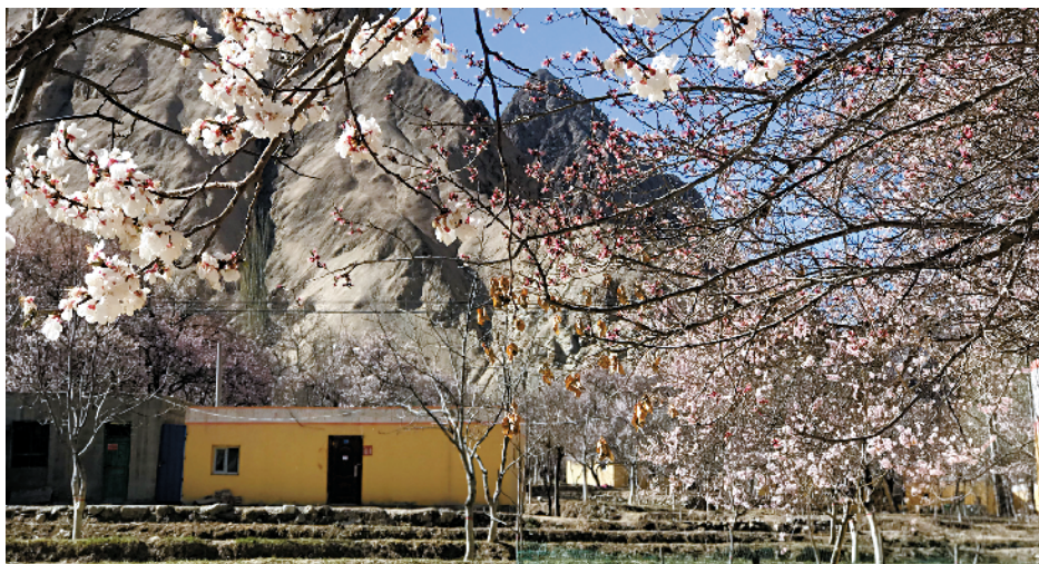
■杏花掩映中的阿勒玛勒克村。