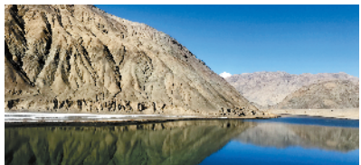
■静谧的塔什库尔干河。