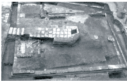
■中共三大会议遗址

河水叮咚,古树葱茏。阳春三月,广州市越秀区新河浦民国建筑保护区内,三栋红砖小洋楼静立于婆娑绿荫中。这里曾是中共中央办公所在地——“春园”,虽历经近百年风雨,仍在从容间见证中国共产党的光辉历程,于无声处激荡风雷壮阔。