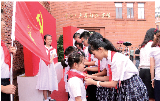
■2019 年广州市越秀区在中共三大会址纪念馆举行活动庆祝“六一”国际儿童节。

“大革命时期周恩来、陈延年领导的中共广东区委,辖区广,党员多。广东全省党员从建立时的几个人,到 1926 年 9 月发展至 5000 人,再到 1927 年夏发展至近万人。”他说,在广东从事革命活动的党员,来自五湖四海,广东区委重视加强党的自身建设,特别是重视开展党内教育,很早就办有党校、党刊,并定期举办政治报告会。区委重视组织建设、制度建设,设主席团制,实行集体领导;区委之下,设“军委”和负纪检之责的“监委”,这两种机构,为当时各地党组织所未有。在党的建设方面,广东区委的许多工作,亦是具有开创性的。