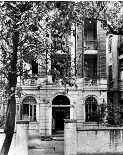
■春园 24 号