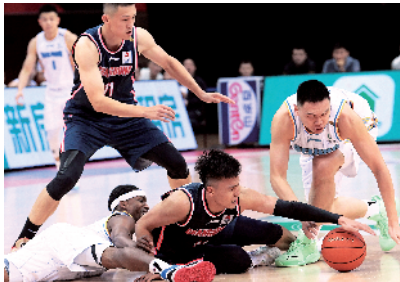
■CBA 第四阶段,广东东莞大益胜北京首钢。

CBA·季后赛 8 进 4 广东东莞大益 VS 北京首钢 今日 15:00 广东体育直播