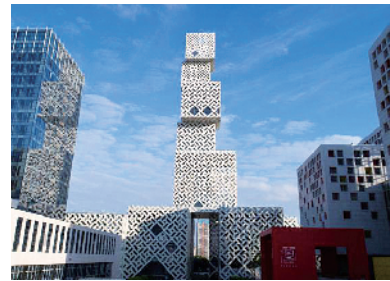
■佛山新城文化中心建筑群