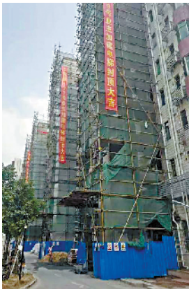
怡德苑小区是广州市黄埔区首个成片连片加装电梯规划试点小区,小区内 4 座连片电梯同时开建。

今年 4 月 15 日,广州市政府常务会议审议通过了《广州市老旧小区改造工作实施方案》。其中提到,支持小区居民提取公积金,用于加装电梯等自住住房改造。对于集资加装电梯的居民,各区人民政府根据实际可给予适当的财政补助。