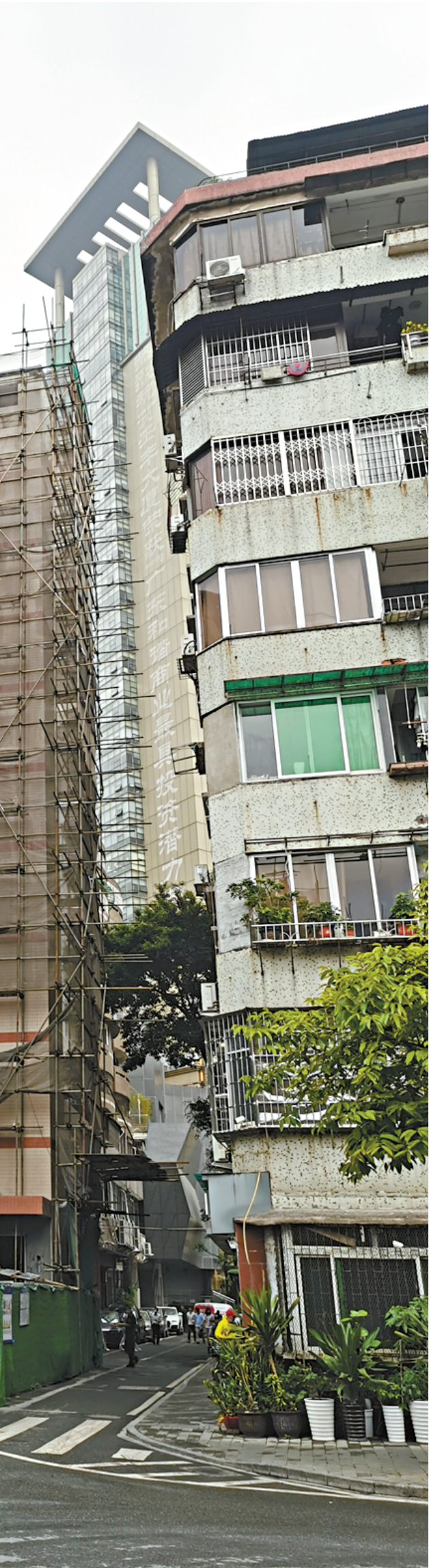
在广州市天河区德欣小区，一栋旧住宅楼正在加装电梯。