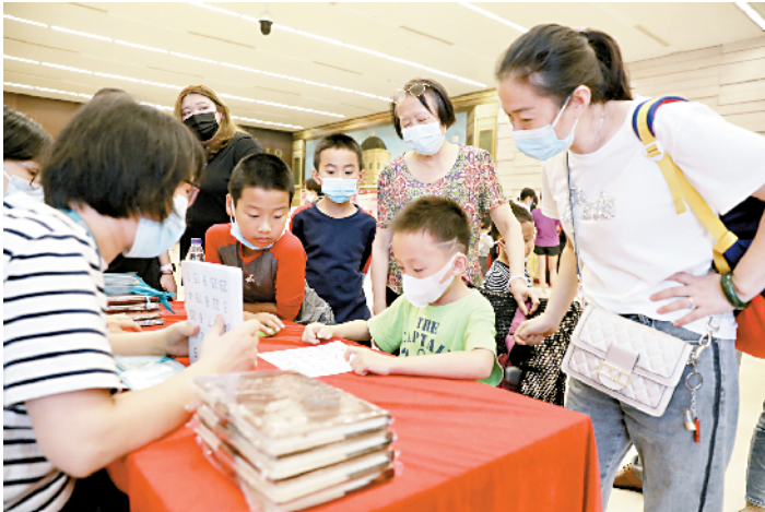
■广州图书馆 举行有趣的嘉 年华活动。

新快报讯 记者李佳文报道 昨日召开的“第六届广州读书月发布会”上,广州图书馆副馆长陈深贵表示,自2014年起,广州图书馆连续6年基本服务指标居全国公共图书馆第一,广州少年儿童图书馆则自2016年起连续4年基本服务指标居全国少年儿童图书馆第一。目前,全市公共图书馆的注册读者量总计为396.79万人,注册读者率为25.92%,首次超过全市常住人口的四分之一。