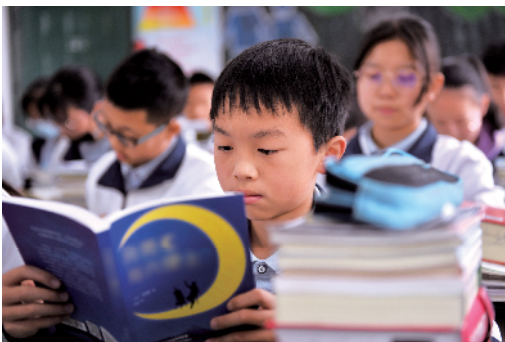
■凉山州民族中学学生正在翻阅获赠图书。

果麦文化拼多多电商负责人透露，果麦在拼多多平台保持了高爆发速度，今年第一季度已经完成去年全年2/3的销售额，“拼多多的新阅读群体，让我们更加了解图书市场的新需求，对于未来增长抱有极大的期待”。