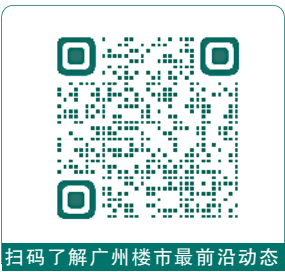
扫码了解广州楼市最前沿动态

虽然4月初和4月底都有调控政策出台,但是4月底两天的集中供地,对一些片区的市场提振起到一定的作用。其次,今年“五一”有五天假期,难得的时间窗口,不少楼盘推新货、加大促销力度。目前房价分化仍在继续。在过去大半年时间里面,有些板块价值提升不少,有些板块仍在2017年水平左右徘徊。预计今年“五一”楼市乃至之后的楼市仍然会呈现这种现象。