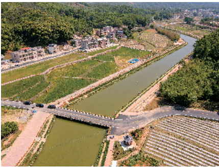
■汕尾市陆河县河口镇引入现代农业企业,将耕地集约化进行机械化耕种。