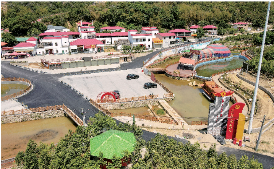
■汕尾市陆河县河口镇宜笏村充分利用红色资源发展红色产业,盘活了村里的土地资源约200亩,开发出红色欢乐谷。

“让土地不丢荒,让农民有收入,让企业有发展”……日前,新快报记者走访了汕尾陆河县河口镇多地,该镇正通过深入推进农村土地改革,大力促进乡村振兴。一方面,配合产业带、旅游带的发展,将偏远地区废弃的宅基地再利用,发展民宿、农庄等项目,发挥宅基地经济效益;另一方面,引入现代农业企业,通过“企业+村委+农户”的方式,将耕地集约化进行机械化耕种,既解决丢荒、保障粮食生产,又为农民增收、企业发展开创了一条新路。