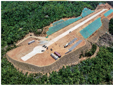
■汕尾市陆河县田墩村将建设新鲲鹏航空飞行运动营地、飞行基地、自旋翼机飞行小镇等。