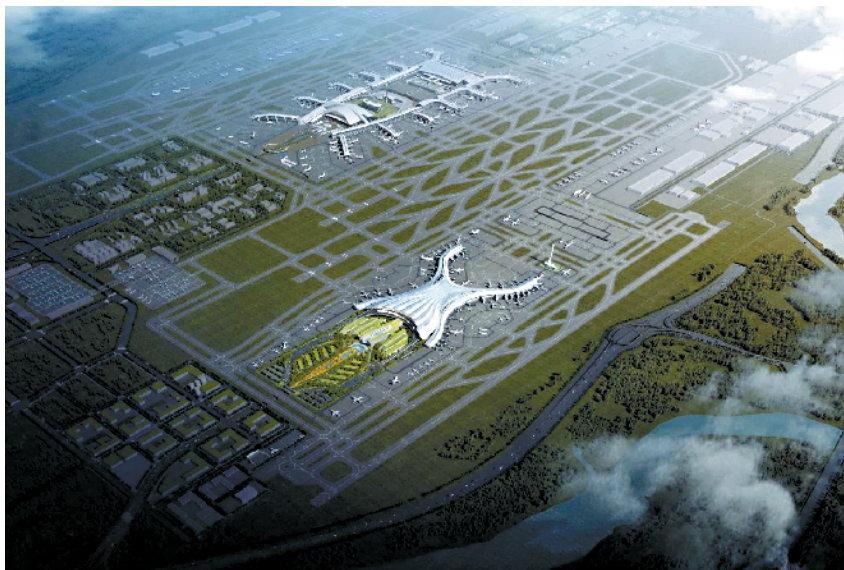
■白云机场 T3 与现有 T1、T2 航站楼(上)。

新快报讯 记者王彤报道 日前,《广州市发展改革委关于白云机场 T3 交通枢纽轨道交通预留工程可行性研究报告的复函》公布。广从城际(广河高铁)、广州至珠海(澳门)高铁将引入白云机场 T3 航站楼。加上此前规划引入的广州地铁 18 号线、22 号线,白云机场 T3 航站楼将形成“双高铁、两城际”轨道布局。