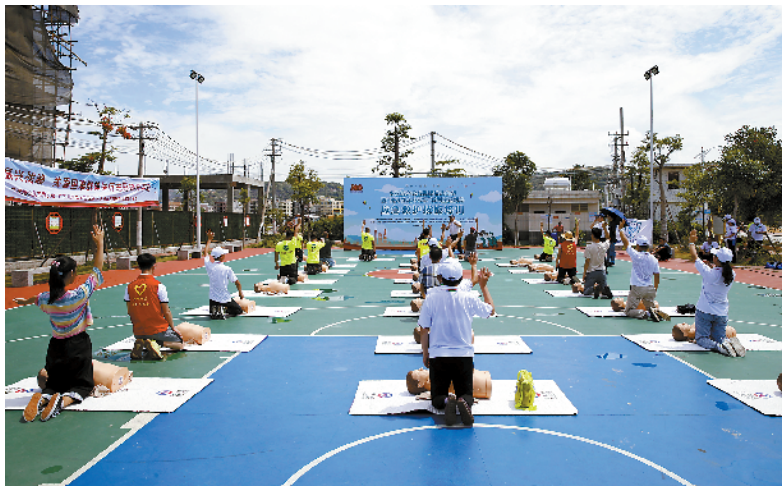
■省二医急救培训现场。

另外,当天,作为“公益帮扶+快速转诊”的主办方之一,省二医推出18个公益项目进乡村。如小耳畸形公益筛查救治项目,广东省宋庆龄基金将为该项目筹集救助金100万元,符合条件的患有先天性小耳畸形的患儿家庭,可提交申请获得手术费用减免。