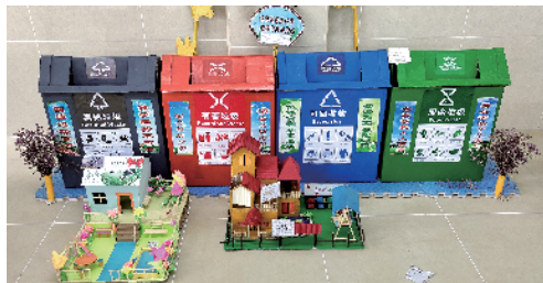
■中新镇垃圾分类“变废为宝”获得幼儿组二等奖作品合照。