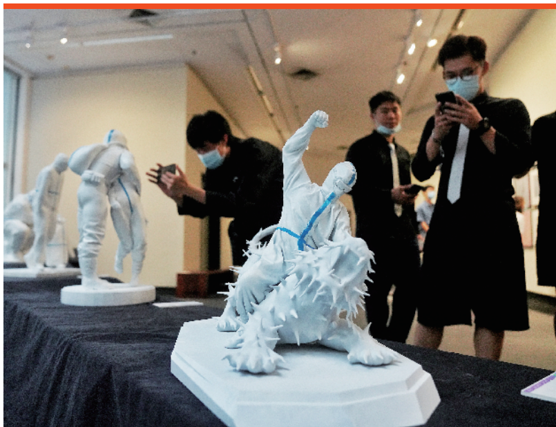
■昨日,2021年广州美术学院研究生毕业作品展在广州美术学院美术馆开幕。

时启动,目前活动已汇聚1.2万+家企业参加,累计提供59万+就业岗位。同时,联合五部门举办“木棉花暖”广东省2021届高校毕业生大型公益网络招聘活动,会同21地市具有代表性高校举办21地市区域系列大型公益网络招聘活动,并将与中国银行广东省分行共同举办第二届“银企携手 职等你来”大型校园网络招聘活动,进一步聚合就业资源,持续为2021届高校毕业生提供更加优质的就业岗位。