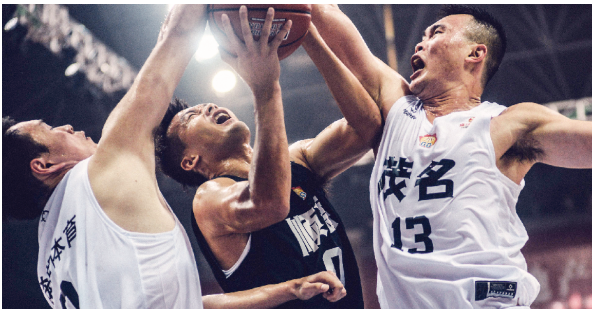
■揭幕战吸引了很多球迷到现场观战。