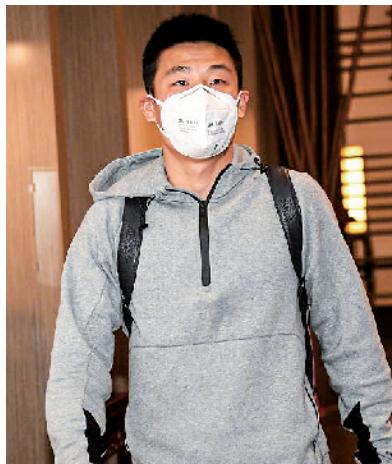
■武磊随国足抵达苏州。

场也设有“红区”,供官方酒店的参赛人员使用。另外,比赛期间,组委会将每三天对“红区”的人员进行一次核酸检测筛查。