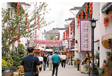
■“客都人家”康养文旅综合体项目，商铺林立，客流如潮。

2018年11月，梅州鼎盛翼文旅产业投资有限公司投资50亿元在红光村建设“客都人家”康养文旅综合体项目，通过“生态+文化+旅游+城镇化”发展模式，汇聚梅州各地星罗棋布的客家文化精华，并迁建50幢明清时期客家古建筑，发扬非遗民俗文化，内设客家剪纸、埔寨纸花、客家花灯、客家婚嫁展示馆等极具客家民俗风情展馆，免费向社会开放，让百姓、游客尽