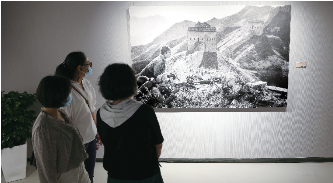
■“红色记忆——沙飞摄影展”5月26日在广州政协文史展示中心三楼展出。

为庆祝中国共产党建党 100 周年,广州市政协与广东新快报社首度联手推出的“红色记忆——沙飞摄影展”于 2021 年 5 月 26 日在广州政协文史展示中心三楼正式展出,与广大市民一起通过影像作品,纪念中国红色摄影先驱,重温红色记忆,传承革命精神,缅怀并致敬那些为中国革命作出卓越贡献的革命先辈,在感受美的同时,坚定信念和汲取力量。