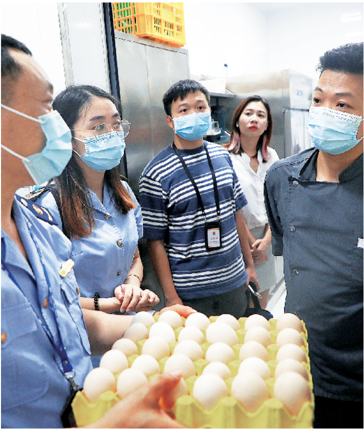
增城区新塘镇多维度防范食品安全风险隐患,切实保障广大人民群众食品安全。图为市场监管人员在辖区内的餐饮场所检查中不放任何一个细节。

通过张贴海报、拉宣传横幅、广播播放《疫情防控你我知》等方式加强禁售野生动物、规范经营及疫情防控知识宣传,引导商户积极配合落实各项防控措施,全面提高群众主动防控与依法经营意识。在出入口安排工作人员宣传讲解,提醒居民注意个人卫生,增强自我保护意识,出门佩戴口罩,勤快洗手,别碰野味,食物煮熟,尽量避免前往封闭或人流密集的公共场所等。