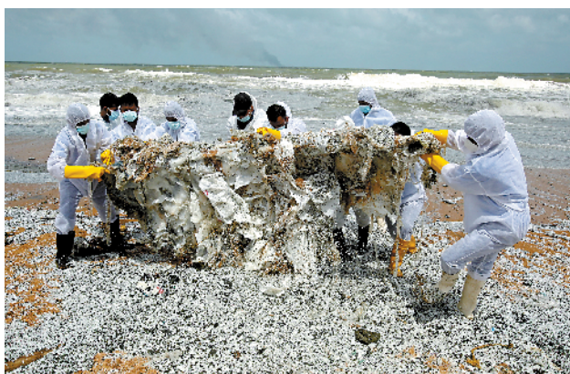
■5月28日,在斯里兰卡尼甘布的一处海滩,安全人员清理海水冲上岸的“X-PRESS PEARL”号货运船碎片。

“X-PRESS PEARL”号货运船在新加坡注册,载有1486个集装箱,其中包括25吨硝酸和其他一些化学品。