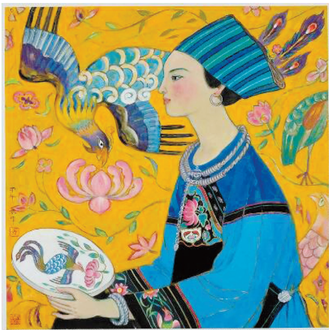
■凤凰戏牡丹 左汉中

时间:6月8日-7月8日 地点:广州市越秀区东风中路268号 广州交易广场2905-2907室“臻致堂画廊”