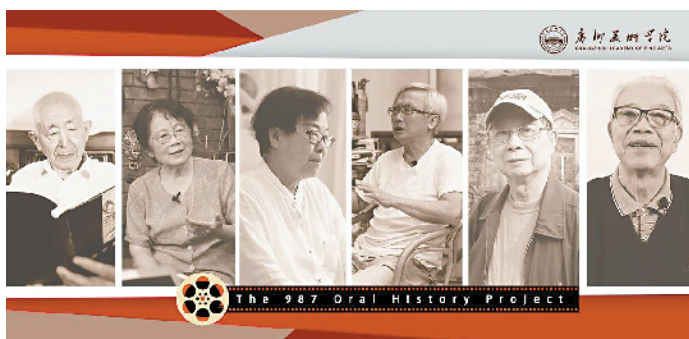
■有温度的美术史——广州美术学院“987 口述史工程”选展四