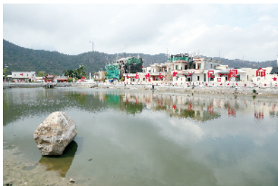
■陆丰市金厢镇下埔村。