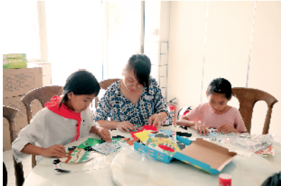
■下埔小学校园内正在做手工的师生们。