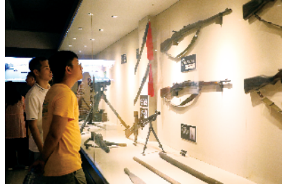
■金厢红色文化馆,每天参观的人络绎不绝。