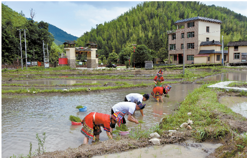
■投入 30 万元激励村民积极复耕梯田。

星河湾集团的定向捐赠确定后，很快，洛阳桥的修复重建被提上日程，去年 10 月，民族特色风雨桥项目启动建设，计划投入资金约 700 万元。目前已经完成了桥身建设，正在进行桥面铺装和防护栏建设，预计今年 7 月底可全面竣工。