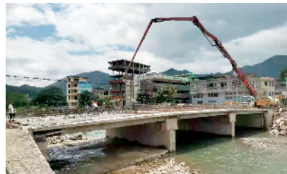
■正在施工的民族特色风雨桥。

然而，由于田心村的土地丢荒比较严重，重现梯田美景面临着水利设施陈旧和复耕农田劳动力不足等现实难题。