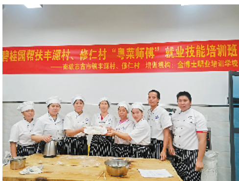
■培训班送课下乡，培养出一批又一批“粤菜师傅”。