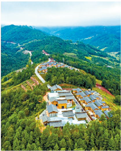
■今日的三河新村村貌。

从2007年开始,碧桂园集团、国强公益基金会便开始持续在四川凉山展开扶贫工作,2020年更是结对帮扶了三河村和署觉洼五村,派出专职扶贫队员驻村发展相关产业,新快报记者日前实地走访三河村看到,围绕巩固脱贫攻坚成果有效衔接乡村振兴,接续文旅发展规划的村史馆、民宿项目及特色餐厅等都已完成布局,除民宿和餐厅正在进行正式运营前的各项调试外,系统详实再现三河村历史发展风貌的村史馆2020年春已对外开放,昭觉县摄影家协会、书法家协会、美术家协会创作基地、昭觉县文学创作基地、昭觉县非遗保护基地等机构相继在三河村挂牌;大山里跑着的乌金猪,更成为碧桂园集团、国强公益基金会专项资金扶持的三河村致富猪……如今的三河村正张开怀抱,准备迎接更为恢弘的发展蓝图。