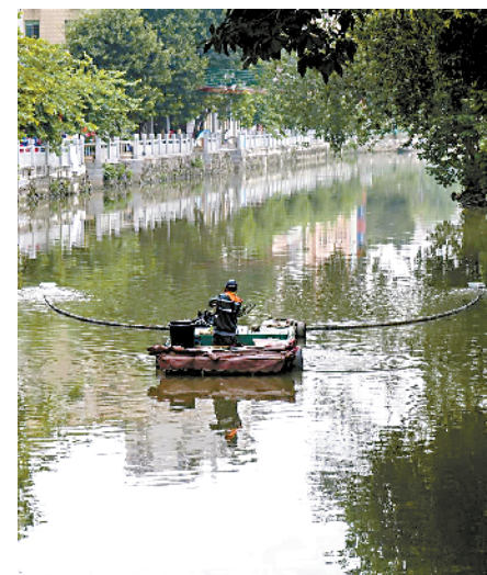
■天河区车陂涌上的河湖卫士

三是增城区《河涌众彩小程序》及数据管理系统获中国测绘学会颁发的测绘地理信息自主创新产品证书。