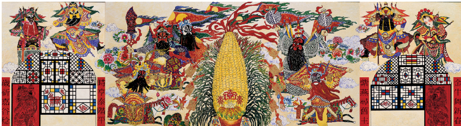
■ 齐喆《丰收了,我们唱大戏》板上丙烯 1997年