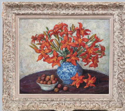
■潘玉良《青瓶百合》