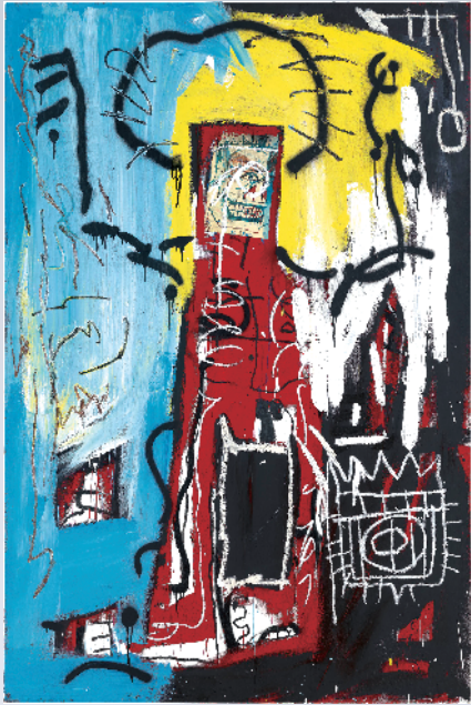
■尚·米榭·巴斯奇亚《无题》