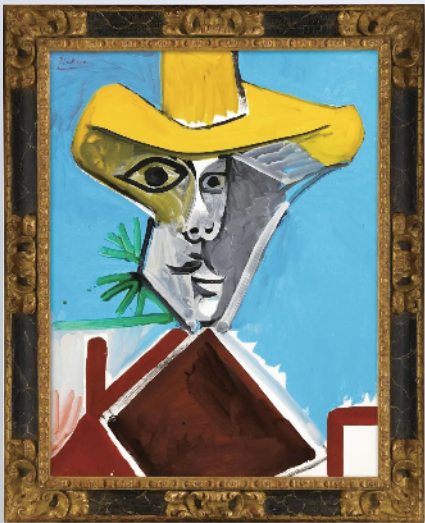
■毕加索《男子半身像》