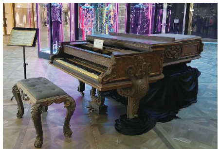
■周杰伦的三组演出服装以及电影《不能说的秘密》中亮相的古董钢琴,将在K11 MUSEA展出。