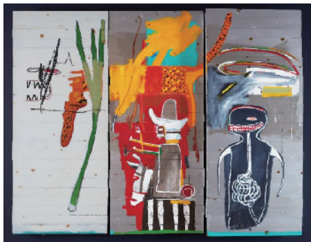
■尚·米榭·巴斯奇亚《无题》1985年作 压克力油彩笔木板 共三部分

“我觉得这三点,就是市场的一个特点,也说明了现当代艺术为什么火爆。因为它代表了我们这个时代,代表了未来”,季涛最后如是说道。