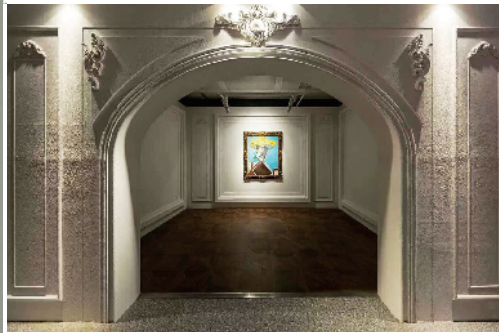
■画作展示场景模仿毕加索作画的工作室