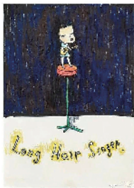
■奈良美智《无声》(左图)和《长发歌手》(右图)