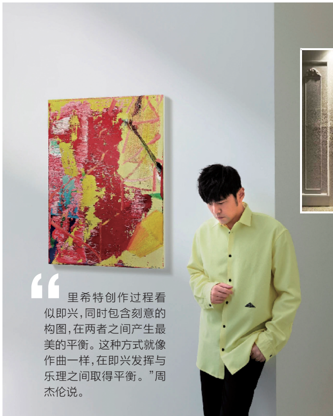
■周杰伦与格哈德·里希特《抽象画》。

其实,现当代艺术板块一直表现火爆。日前,就此现象,艺术市场资深研究学者季涛在接受新快报收藏周刊采访时就直言:“现当代艺术这个板块近两三年进步非常快,一路走强!”