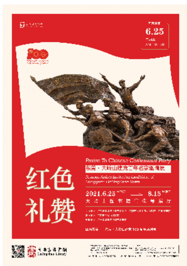
■红色礼赞展览海报