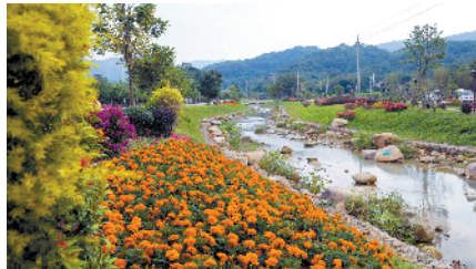
■增城区邓山河碧道