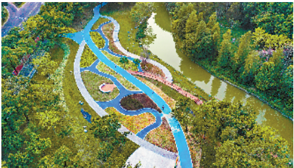
■风景如画的番禺区大学城赤坎涌碧道