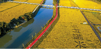
■从化区黎塘海碧道