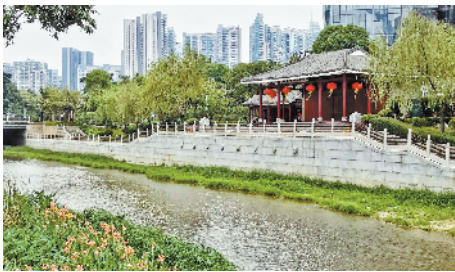
■天河区猎德涌碧道

天河区车陂涌曾是全市有名的“墨水河”。在对车陂涌进行碧道建设的同时,通过控源+截污+清污分离,使车陂涌实现全面消除黑臭,周边的生态系统得到了根本改善。时隔 40 年,车陂涌重现夜晚流萤飞舞的景象。