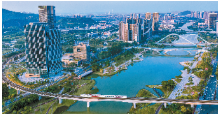
■俯瞰南沙区蕉门河碧道