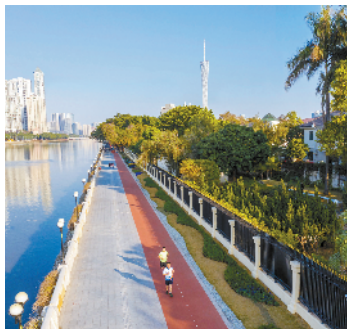
■越秀区二沙岛碧道