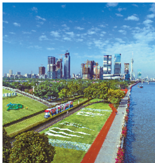
■海珠区阅江路碧道

南沙蕉门河碧道建设以水上运动为基础的水上游道,发展皮划艇、桨板、赛艇等多项群众性水上活动,展现碧道的多元活力。