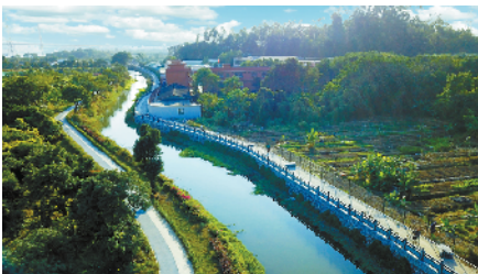
■黄埔区长洲四号涌碧道风景如画

白云区新市涌在碧道建设中因地制宜,打通建筑首层,融入岭南特色元素建设骑楼碧道。此设计既打造了巡河通道、防汛通道,又复原了骑楼老街风光。