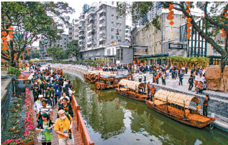
■荔湾区荔枝湾湖碧道