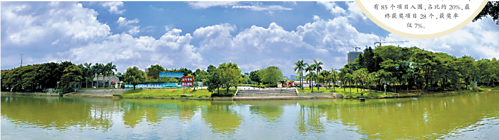
■白云区石井河碧道

2021 年,WLA 奖共包括大型公共类、住宅类、小型景观类、城市空间类、分析与规划类、概念设计类和编辑推荐类七个奖项,收到了来自世界各地的 400 多份参赛作品,仅有 85 个项目入围,占比约 20%,最终获奖项目 28 个,获奖率仅 7%。