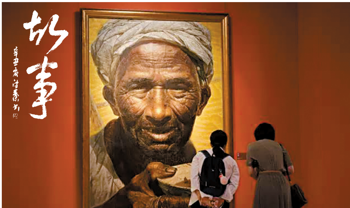
■观众在中国美术馆欣赏罗中立作品《父亲》。中国美术馆供图