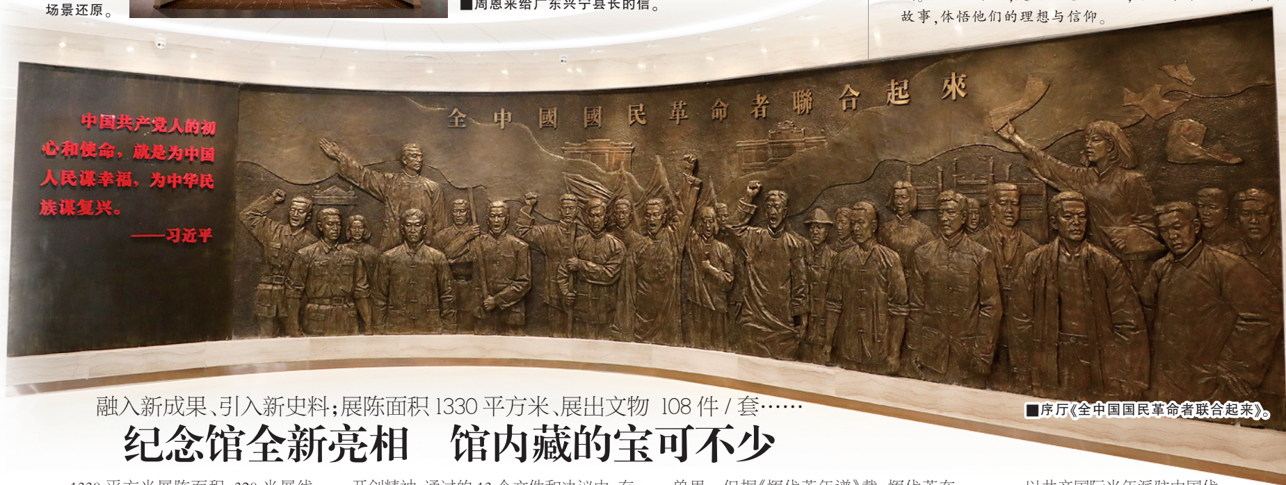
■展厅《全中国国民革命者联合起来》。

在中共三大代表中,有18人牺牲在新民主主义革命时期的奋斗征程中,他们将短暂的生命定格在最灿烂的年华,用自己的生命和热血铸就共产党人的信念与忠诚。扫描二维码,走进历史的回响,可以聆听他们的革命故事,体悟他们的理想与信仰。