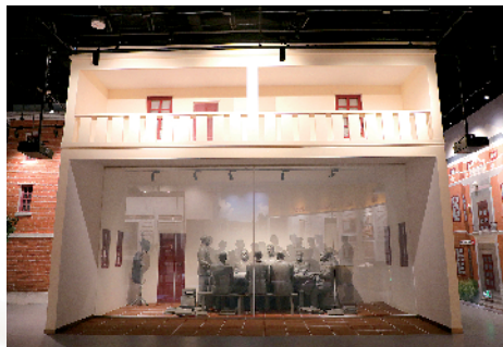
■三大会议场景还原。