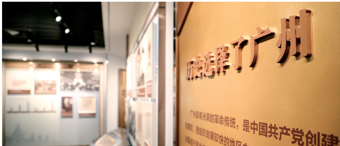
■纪念馆内部第一部分上下求索,介绍了中共三大召开的历史背景。