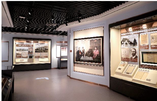
■馆内展陈丰富多样。