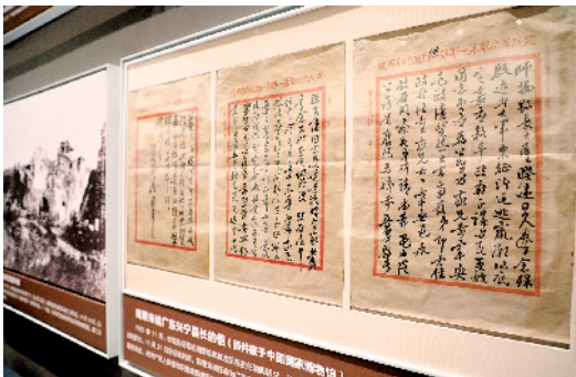
■周恩来给广东兴宁县长的信。