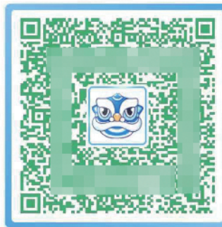
■第一针打完后的狮子。