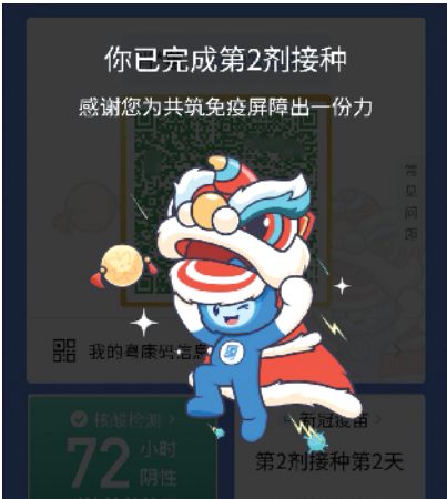
■点击二维码中的图案后还会弹出小狮子。