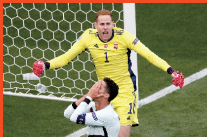
■6月15日,葡萄牙队球员克里斯蒂亚诺·罗纳尔多(前)错失进球良机。