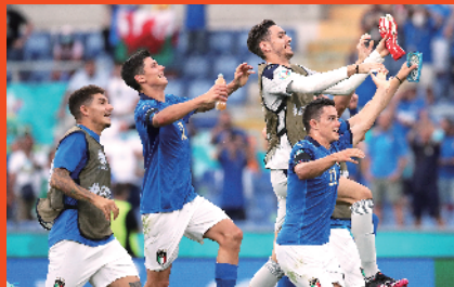
■6月20日,意大利队球员在比赛后庆祝胜利。