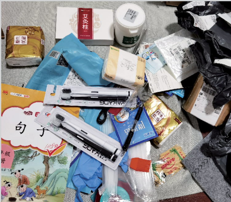
■新快报记者购买的快递盲盒

新快报记者在某短视频平台发现,有测评博主购买了 5 个网上宣称“必中苹果”的盲盒,却只拆出低于实际售价的“垃圾手机”。其中,售价 199 元的“快递盲盒”拆出了某闲置平台售价 49.9 元的二手手机;售价 60 元的“快递盲盒”只拆出了 4.8 元的苹果手环,另外三个分别是无法开机的苹果 4、联想老人机、手机模型。