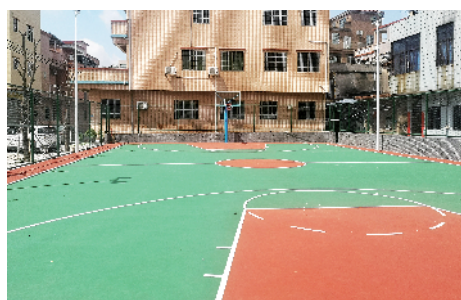
■升级改造后的球场。