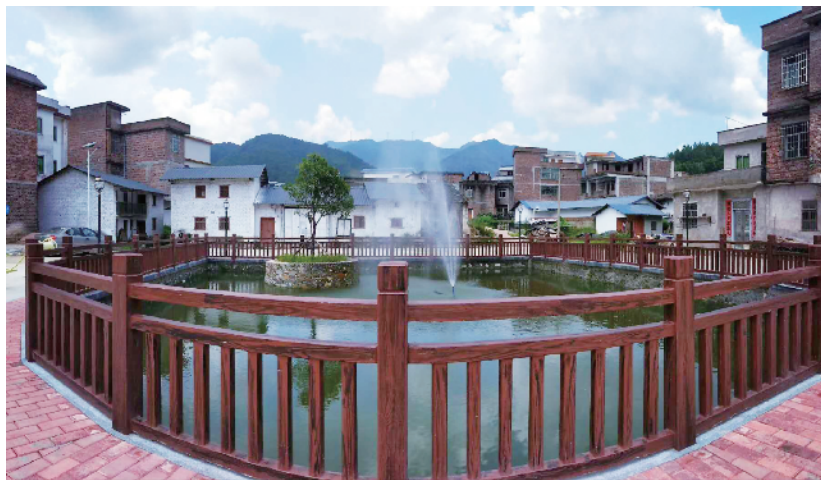
■长江村变美变干净了。

农闲时去干什么？打篮球，约一个；广场舞，跳起来；去遛弯，天黑也不用急，路灯一路照到家。过去两年中，长江村利用万科捐赠资金，建起了多功能文化广场，为村里亮起了路灯，自来水管网入户，极大地提升了村里的人居环境质量，丰富了村民的娱乐生活。