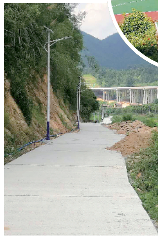
■长江村建起了篮球场。