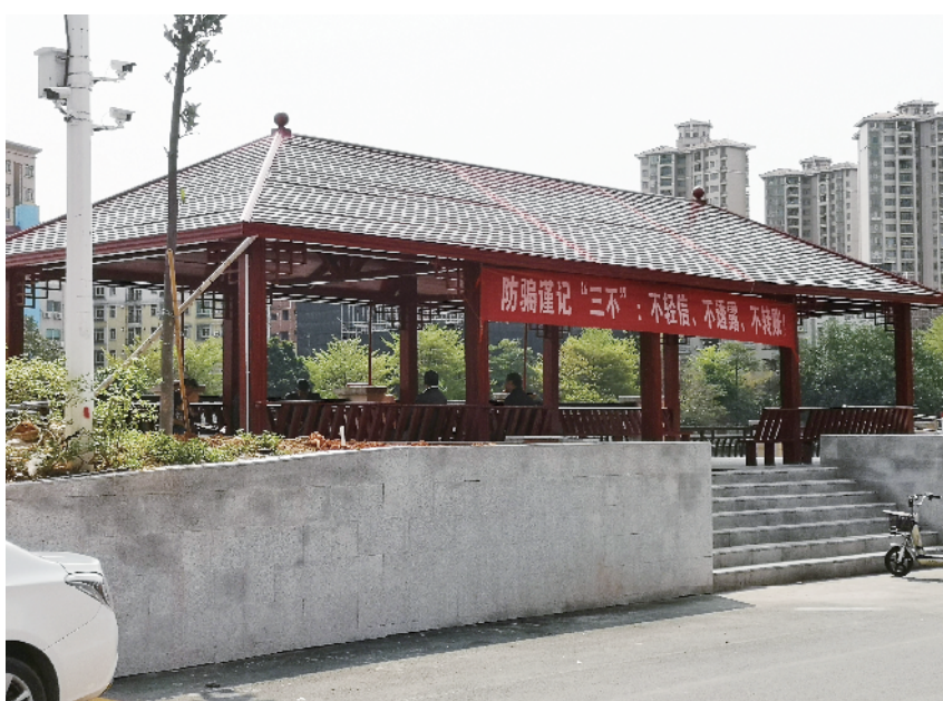
■援建凉亭方便群众。

从2018年至今，玖龙纸业(控股)有限公司(以下简称玖龙纸业)通过广东省扶贫基金会捐资70万元，用于支持经济次发达的东莞市麻涌镇麻四村开展乡村振兴项目，主要包括完善村中基础设施、环境整治等。多年来，经过东莞市人大的对口帮扶和社会各界的鼎力相助，麻四村不仅已有超过80户贫困户实现了稳定脱贫，而且通过“造血”项目开展、村容村貌整治等一系列措施，从一个经济次发达村一跃成为村集体收益超过千万级的“文明标兵村”。