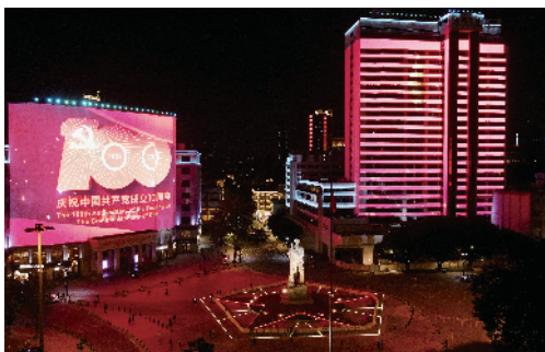
■海珠广场灯光秀呈现岁月变迁之中的广州。