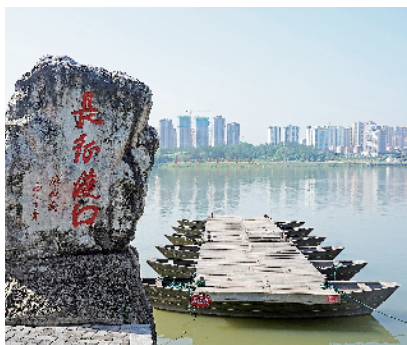
■位于江西省于都县的长征渡口。