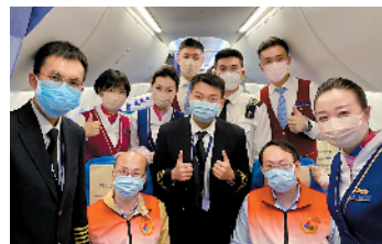
■2020年1月25日,南航护送广东医疗队前往武汉抗疫的航班乘务组。

此外,党支部内建立的“红皮本”+“蓝皮本”制度,将作风建设与技术能力贯通结合,确保南航实现连续256个月飞行安全和321个月空防安全,持续保持中国民航最好的安全纪录。