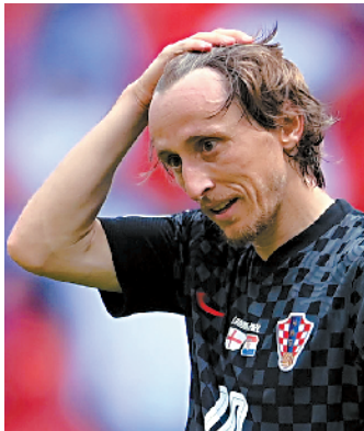
■看到了没,莫德里奇的发际线也后移了。

对38岁的北马其顿队长潘德夫来说,欧洲杯是一次圆梦之旅。即便小组赛3战尽墨,北马其顿的成绩没法令人满意,但在欧洲杯上打进一球,然后结束国家队生涯,潘德夫可以无憾。潘德夫说:“大多数国家队比赛,我都是失败的一方,能在职业生涯的末期参加欧洲杯,对我和我的国家来说都是非凡的,感谢所有人,谢谢!”