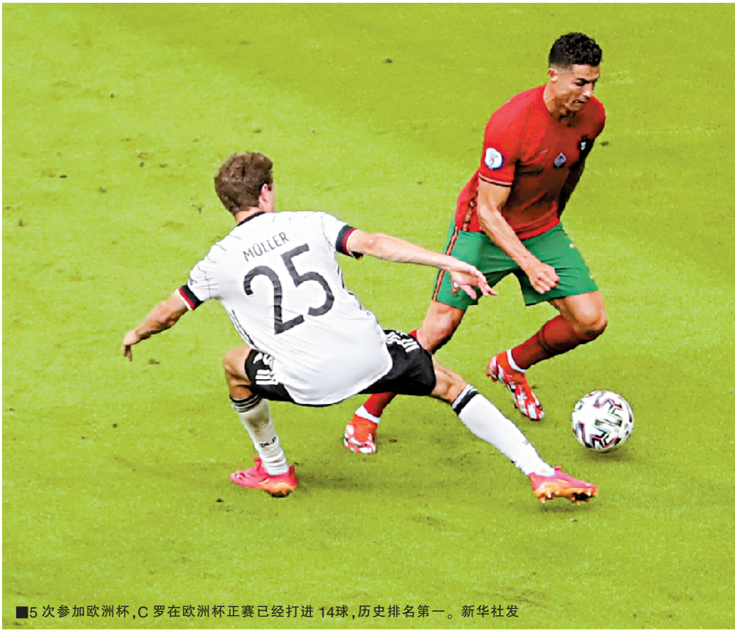
■5次参加欧洲杯,C罗在欧洲杯正赛已经打进14球,历史排名第一。