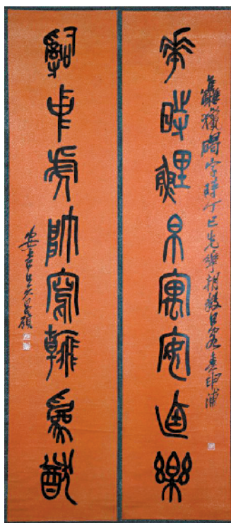
■吴昌硕《篆书八言》故宫博物院藏

由浙江古籍出版社出版的金翔、王青云所编著《老缶遗踪吴昌硕艺术人生记录》,像打开的花洒一样,思路清晰,文笔简练,线索众多而不乱,把吴昌硕的一生浓缩在这本书里。其实,在笔者看来,里面的几千幅图片、史料,更为难能可贵。光资料收集,就花了编著者金翔、王青云好几年的光景。这本书把吴昌硕的祖宗十八代都阐述清楚了,更把吴昌硕的一生展现得淋漓尽致。无论是早年的求师问友还是晚年的执掌西泠,把他的人生轨迹刻画得一清二楚。