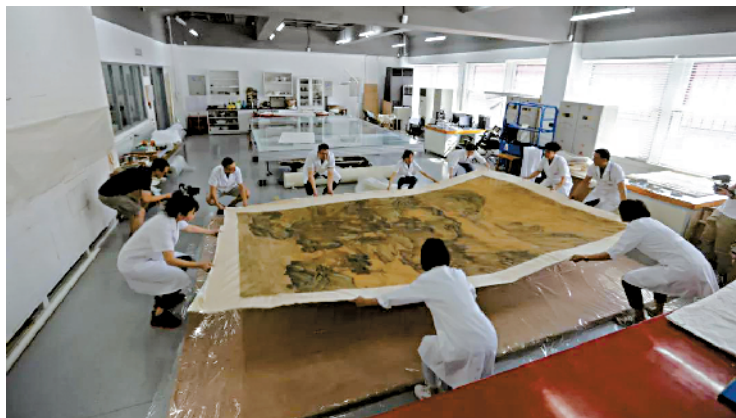
■文物修复师们将画作回潮绷平