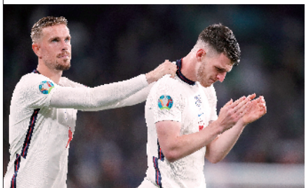
■离冠军如此之近,英格兰球员脸上写满不甘。

本届欧洲杯,意大利队并非夺冠热门。这不仅仅因为意大利队无球星压阵,更在于意大利队是一支败军之师。2018年俄罗斯世界杯,意大利队竟然没能入围决赛圈。