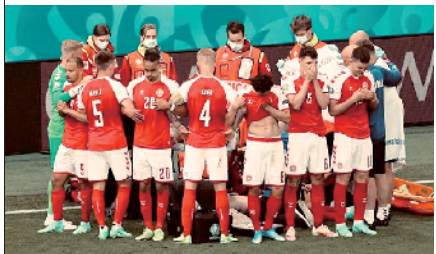
■感动了全球观众的“丹麦人墙”。