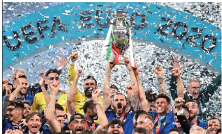
■烟花璀璨,意大利人笑到了最后。