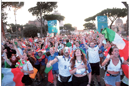
■意大利球迷,欢乐的心情难以言表。