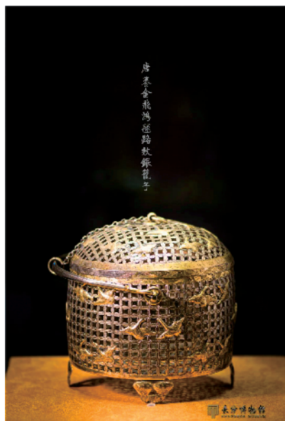
唐鎏金飞鸿踏路纹银笼子

教道场,佛家圣境”和“奉珍献宝,礼佛祈福”三个单元部分,依次展示法门寺悠久历史、汉传密教文化和唐代的贵族生活。鎏金铜浮屠、金银宝函、锡杖、雀鸟纹香囊、银质茶具等金银器具,富丽堂皇,展现出唐代精湛的手工艺技术和富丽的物质