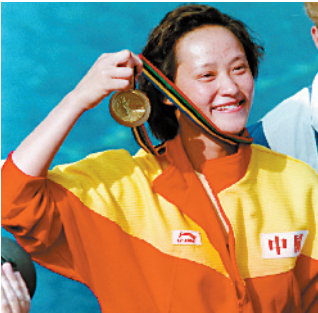
■高敏从 1986 年到 1992 年,在参加的所有重大国际赛事中保持全胜,开创了一个长达 7 年的“高敏时代”。