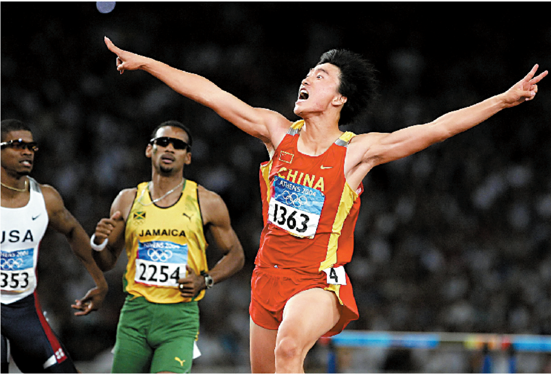
■2004 年,中国选手刘翔在雅典奥运会男子 110 米栏中夺得金牌。

北京奥运会的成功举办,也让 1908 年《天津青年》的最后一个问题画上了句号。中国用 100 年时间完成了从参加奥运会到举办奥运会的征程。