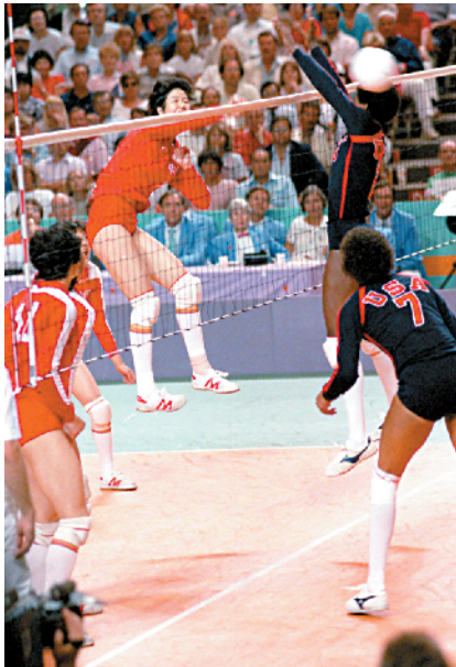
■在洛杉矶奥运会,中国女排直落三局战胜美国女排,夺得中国在奥运会上的第一枚三大球金牌。

1984 年 7 月 28 日,洛杉矶奥运会正式开幕。第二天的射击场上,许海峰的枪声就打破了中国在奥运会上金牌“零”的纪录,而这也是此次奥运会的第一个比赛冠军。国际奥委会主席萨马兰奇闻讯赶到射击场,亲自为许海峰颁奖并郑重宣布,中国运动员获得本届奥运会第一枚金牌。