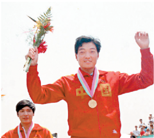
■1984 年,许海峰为中国夺得第一块奥运金牌。

1948 年伦敦奥运会,中国再次参加奥运会,身高 1.9 米的控卫黄天锡出任旗手。不过,这 3 次奥运之旅,中国队皆因国力衰败而没能“得牌”。