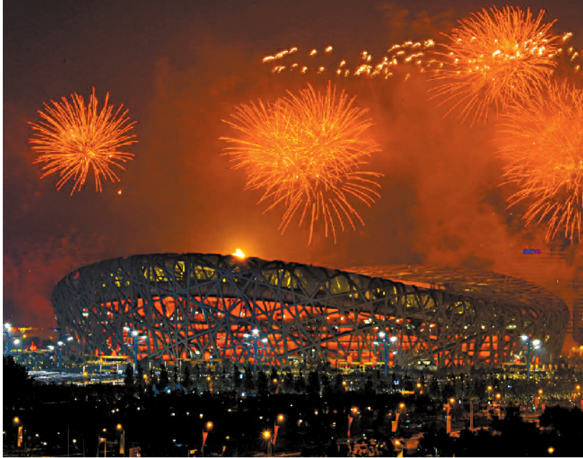
■2008 年 8 月 8 日,第 29 届北京奥运会开幕式在北京国家体育场隆重举行。