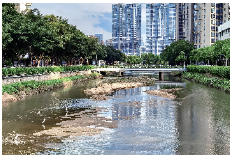
■澄清的猎德涌引来了白鹭。