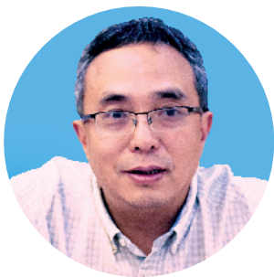
■广州市水务局局长、广州市河长办常务副主任龚海杰。