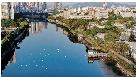
■治理后的石井河引来成群白鹭栖息。