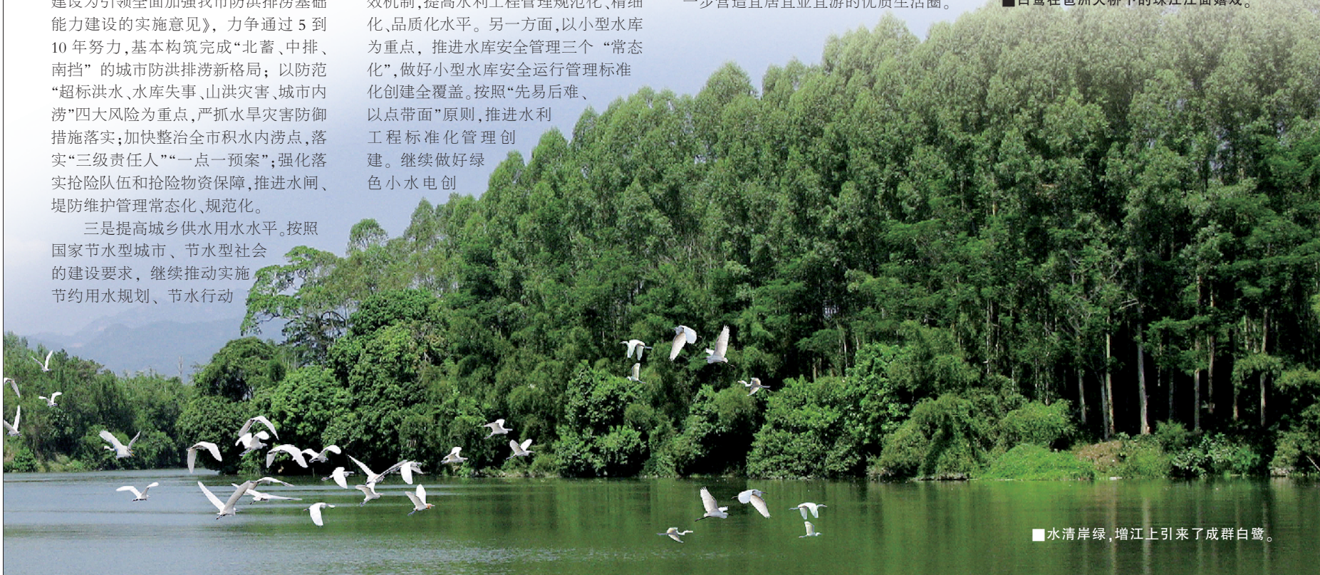
■水清岸绿，增江上引来了成群白鹭。