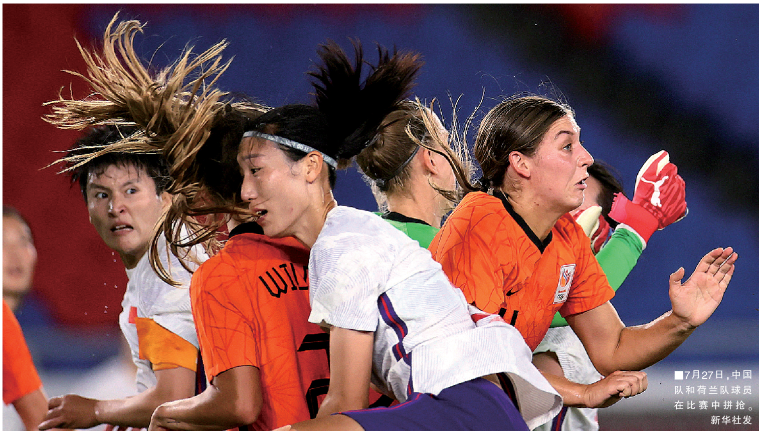
■7月27日,中国队和荷兰队球员在比赛中拼抢。