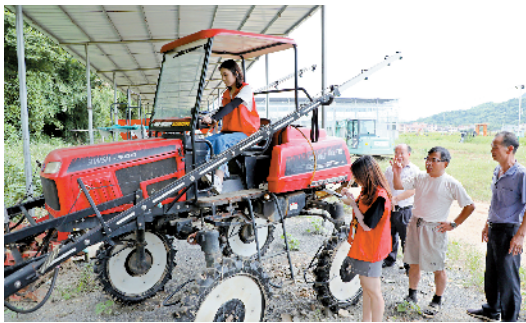
■中心工作人员到七拱镇火岗村金穗华晨丝苗米三产融合科技示范基地了解农机安全性操作及作业轨迹盒子安装情况。