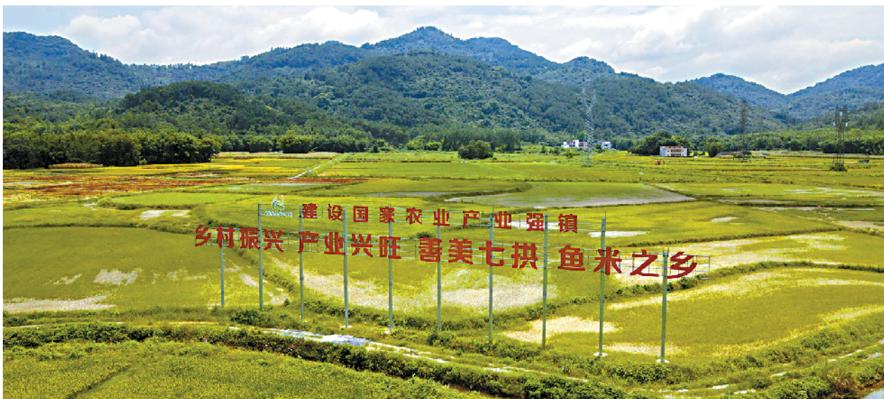
■七拱镇火岗村金穗华晨丝苗米三产融合科技示范基地。

作为广东农业生产托管的试点县之一,阳山县已率先建起农民合作社服务中心、农业生产托管运营中心,在全部镇村开创性地进行合作社服务和重点镇村辐射周边镇村开展农业生产托管。“全链条培育合作社”“整村推进生产托管”“建立农机联盟”等一批在实践中形成的现代化农业生产经验,有望在全县甚至全省借鉴推广。