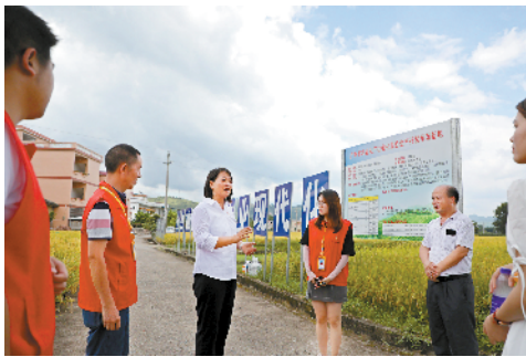
■中心工作人员到七拱镇隔坑村广东省农业生产社会化服务生产托管示范基地调研交流。