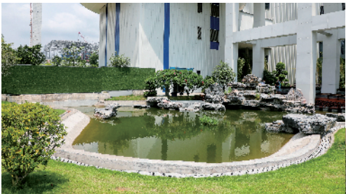
■广州环投七大循环经济产业园以低碳环保为主题,打造复合型环保主题公园。