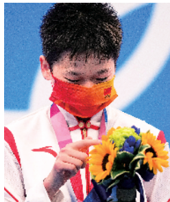
■全红婵在颁奖仪式上。