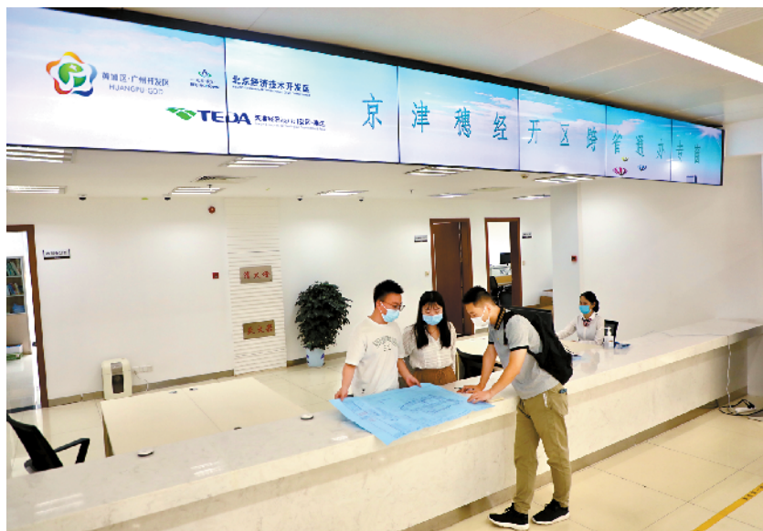
■广州开发区设置了京津穗经开区“跨省通办”专区。

为了保障“跨省通办”服务质量,京津穗经开区三地实现审批系统跨区域互通互联,在各自审批系统上开辟“跨省通办”专区,互相为另外两地配置系统账号,业务系统的受理、审批、查询、出证等各环节数据互访。三地还同步建立了异地收件、问题处理、责任追溯和数据安全保障等工作机制,明确收件地和办理地的工作职责、业务流转程序等环节,确保