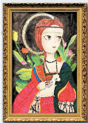
■稻田美术学生作品