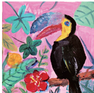
■U艺术空间《大嘴鸟》 (黄诗彤 7岁)