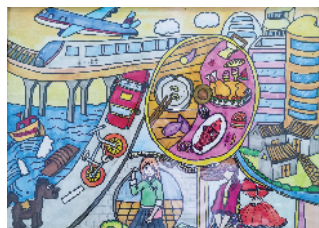
■安格美术创意班学生作品