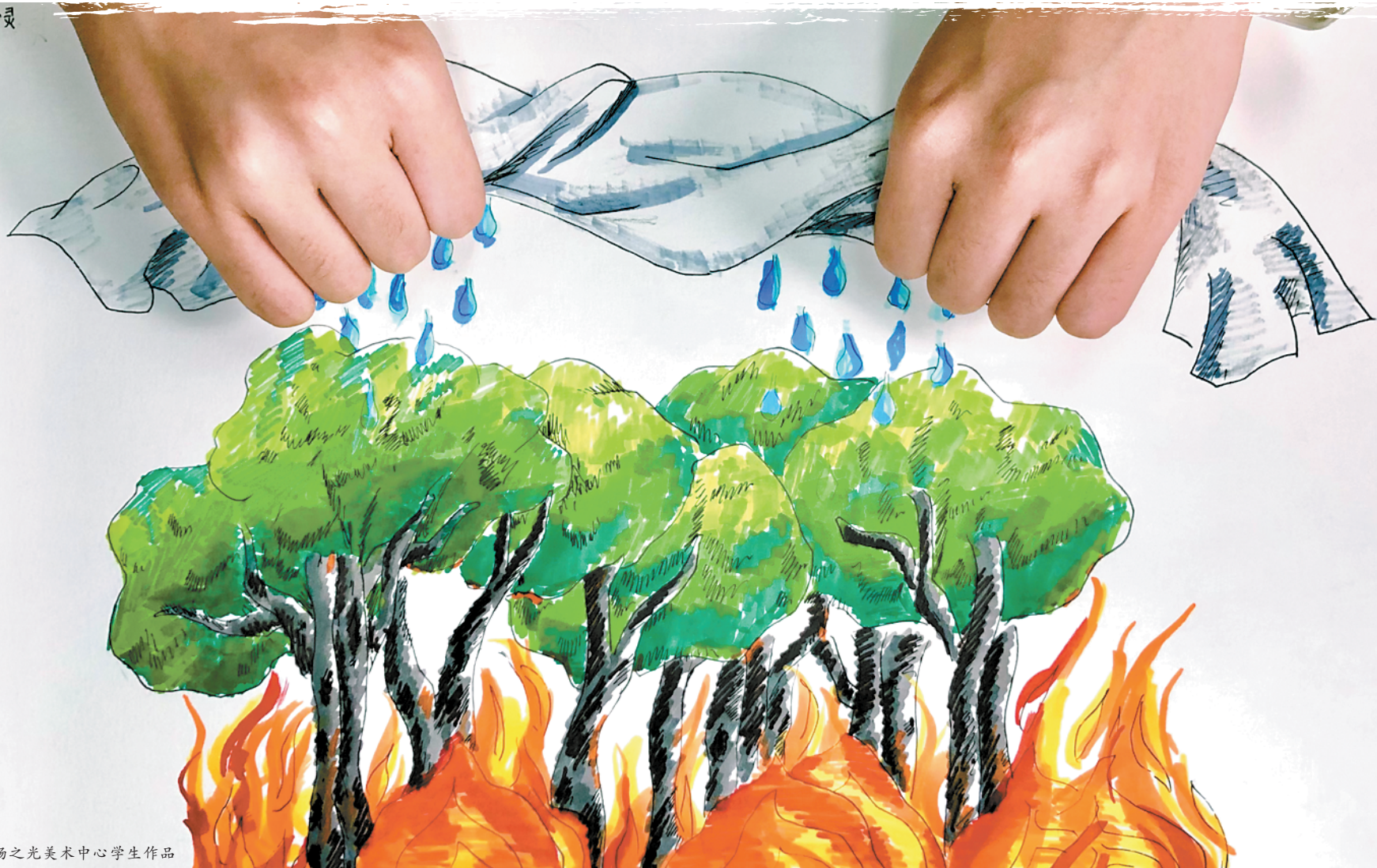
■杨之光美术中心学生作品